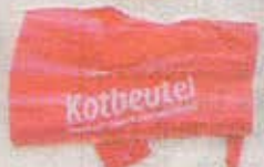
Saubere Sache: Kotbeutel (120 Beutel kosten z. B. bei Fressnapf 5,99 Euro)