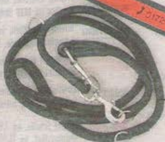
Zwei Meter lange Leine aus weichem Leder (22,50 Euro für kleine Rassen, 32,50 Euro für große Hunde, z.B. bei Fressnapf). Auf dem Halsband muss die Telefonnummer des Halters stehen