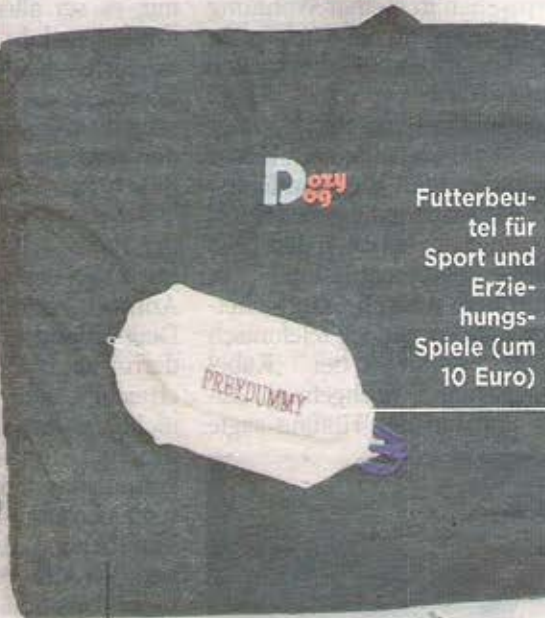
Futterbeutel für Sport und Erziehungsspiele (um 10 Euro)